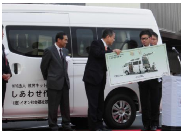
イオンタウン湖南贈呈式（ザ・ビッグエクストラ湖南店 2014年12月）

当SCにおいては、社会福祉法人鈴鹿市社会福祉協議会(使用施設：鈴鹿市障害者生活介護施設ベルホーム)へ福祉車両を贈呈させていただきます。