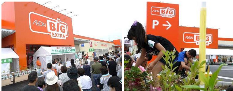
2015年7月5日ザ・ビッグエクストラ山県店「イオンふるさとの森植樹祭」実施風景

イオンは新店のオープンに際して、その地域に自生する樹木の苗木を地域の皆さまと共に植える植樹活動を行っています。当SCでは10月29日（土）に「イオンふるさとの森づくり」植樹祭を開催いたします。