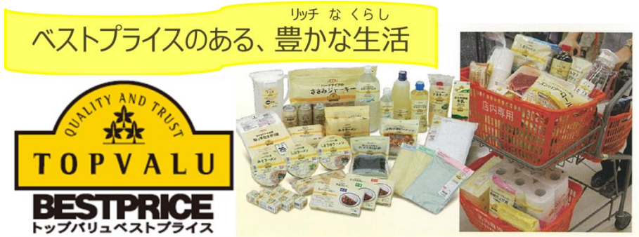
イオンのプライベートブランド「トップバリュベストプライス」 ～納得品質で地域いちばんの低価格を目指します～