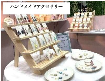
ハンドメイドアクセサリー