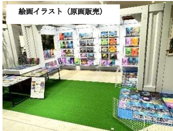
絵画イラスト (原画販売)