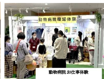
動物病院お仕事体験