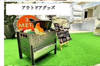
アウトドアグッズ