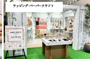
ラッピング・ペーパークラフト