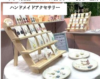
ハンドメイドアクセサリー