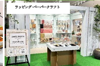
ラッピング・ペーパークラフト