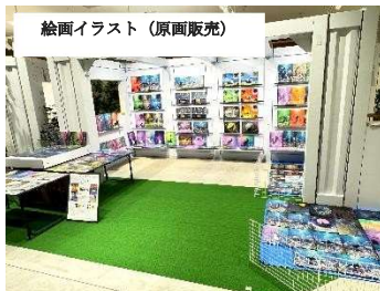
絵画イラスト (原画販売)