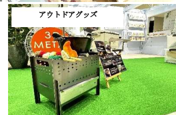
アウトドアグッズ