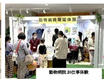
動物病院お仕事体験