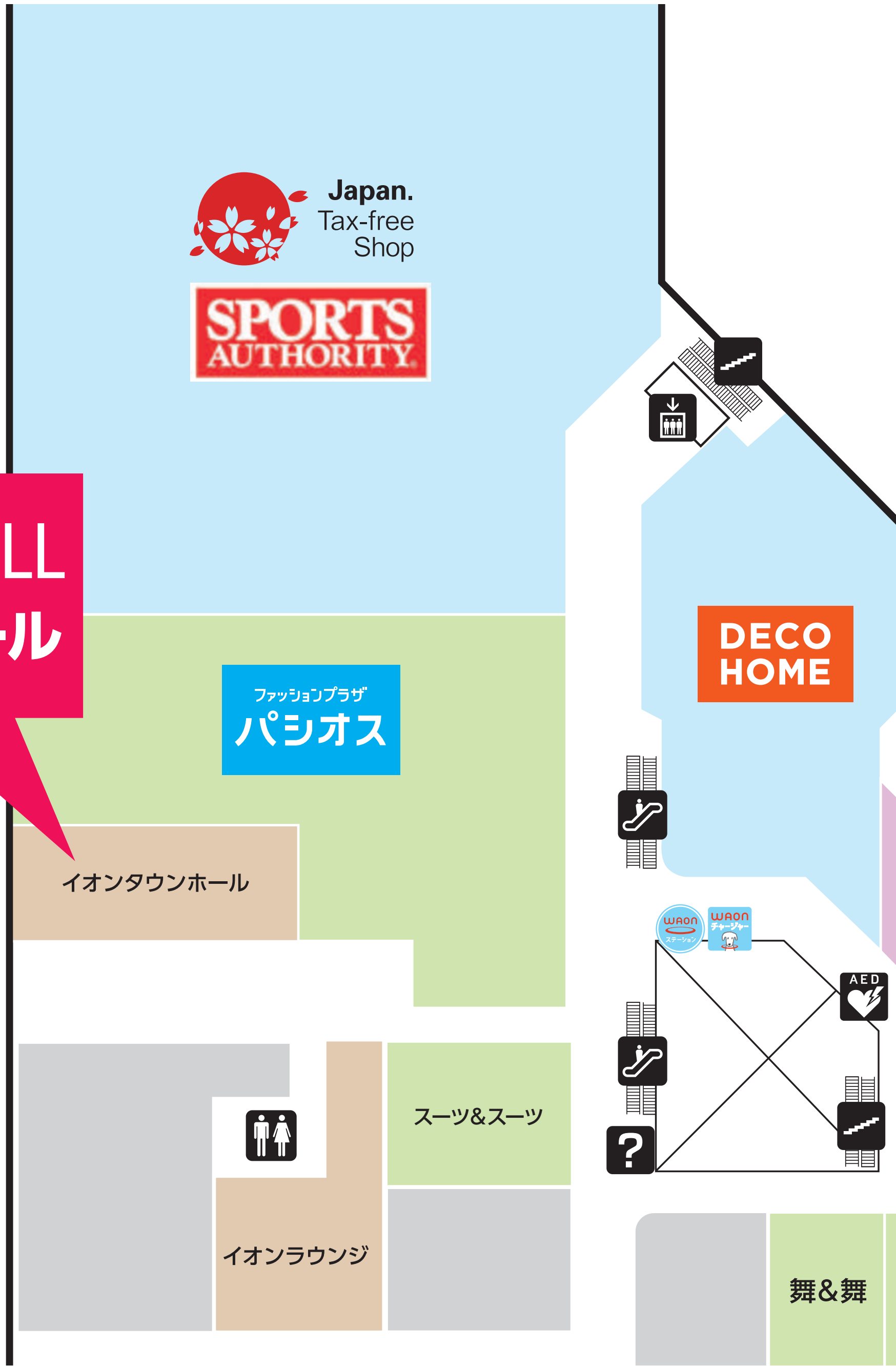
イオンタウンホール