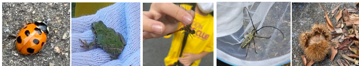
イオン札幌平岡店(北海道) ナナホシテントウ