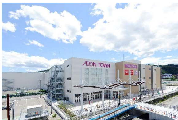
イオンタウン釜石