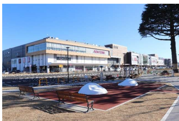
イオンタウンふじみ野