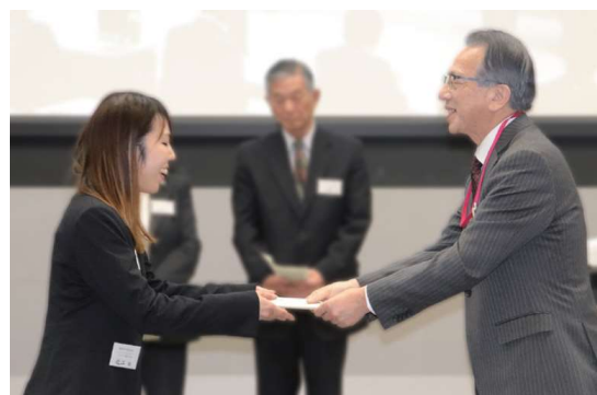
▲2019年度ハッピーレター賞授賞式様子