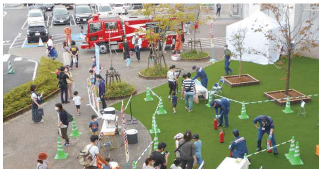
▲SCで実施した防災イベント実施様子