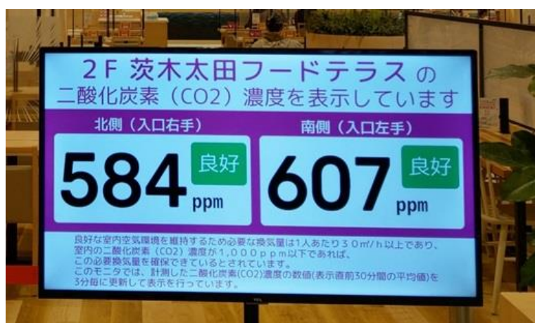
3分毎にCO 2 濃度測定結果を更新

今回導入したモニターシステムは、CO 2 センサーで測定したCO 2 濃度データをクラウドサーバーを通じて連携し、離れた箇所の大型モニターに表示するシステムです。