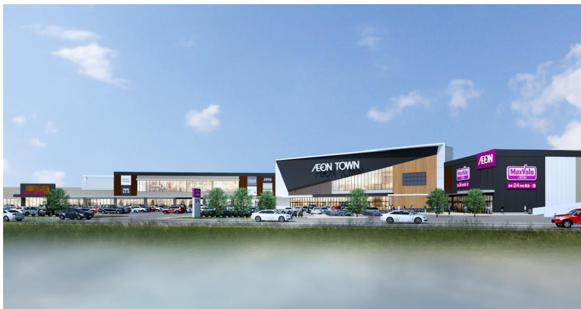
国道1号線側から見たイメージ

～地域の皆さまに寄り添い、これまで以上に笑顔でお過ごしいただけるSCを目指して～ 『集い・育み・元気発信！3世代パワーステーション』