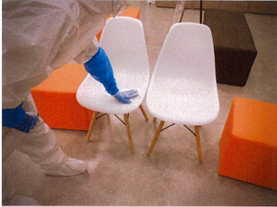
消毒作業 ペテモ内生体売場