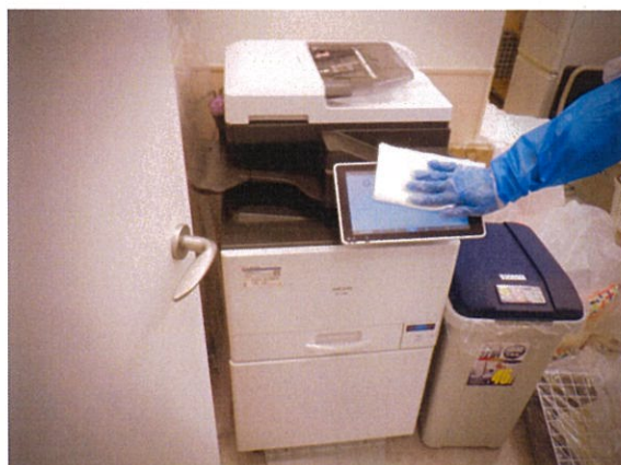
消毒作業 ペテモ内生体 後方