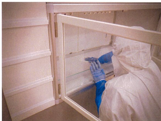
消毒作業 ペテモ内生体売場