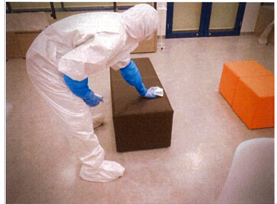
消毒作業 ペテモ内生体売場