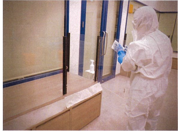
消毒作業 ペテモ内生体売場