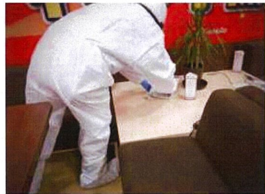
消毒作業 2F ソフトバンク(売場)