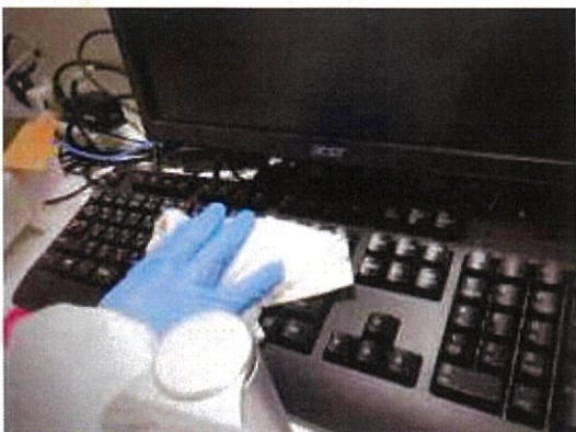
消毒作業 2F ソフトバンク(売場)