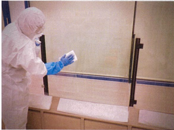
消毒作業 ペテモ内生体売場