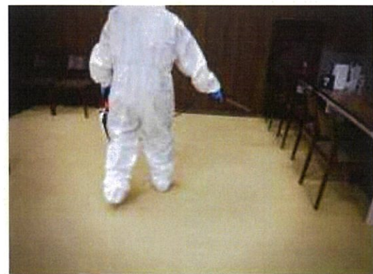
消毒作業 2F ソフトバンク(売場)