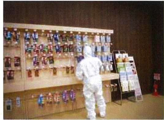
消毒作業 2F ソフトバンク(売場)