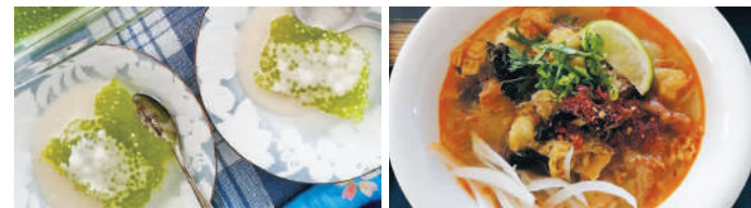
タピオカデザートを作ります レレさん自慢のごちそうスープ(イメージ) ※スープはレレさんが作ってくれます