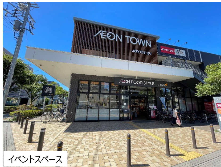
イベントスペース