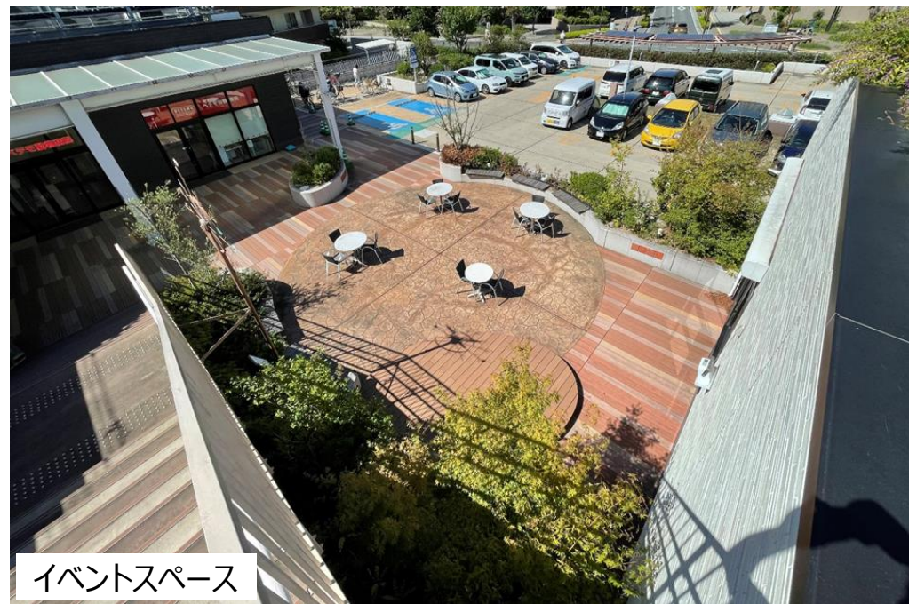
イベントスペース