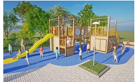
防災倉庫を兼ね備えた遊具