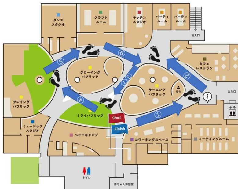
おひさまテラス内のウォーキングルート