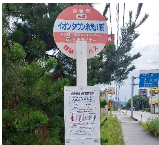
▲「イオンタウン糸魚川前」バス停