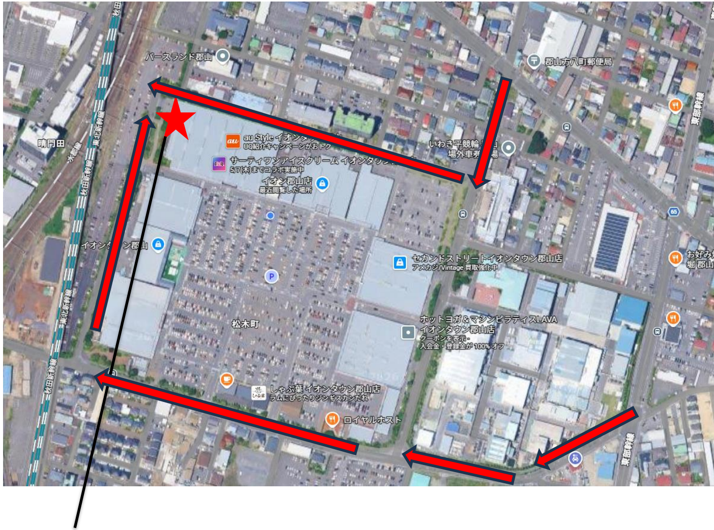
荷受場シャッター

イオンタウン北西の角に荷受場がありますので、荷受場の駐車場にお越し下さい 荷受場シャッター内に警備受付がありますので、こちらにお声かけ下さい