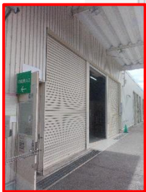
荷受場シャッター