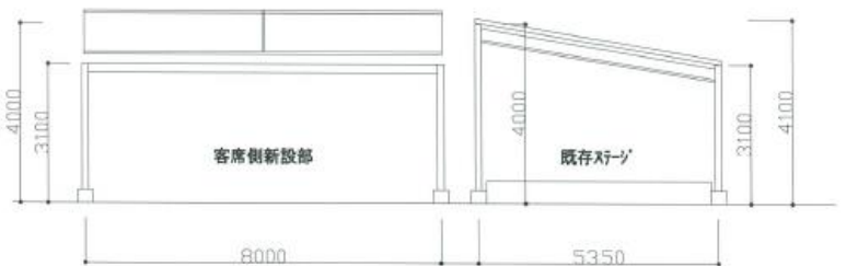
イオンタウン郡山 イベント広場日除け