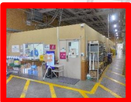
警備受付・SC管理事務所